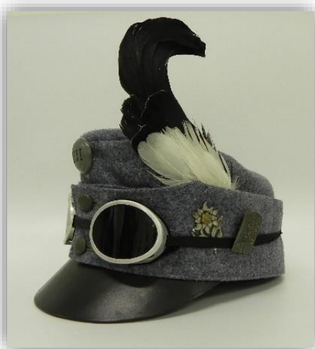
Vojaška kapa z ruševčevim krivčkom je bila značilno pokrivalo pripadnikov avstrijskih gorskih enot.

Leta 1910 so za pripadnike gorskih enot uvedli posebne planinske sivo-modre ( hechtgrau ) volnene uniforme. Osnovno uniformo so sestavljali: kapa, suknjič, pelerina s kapuco, plašč, pumparce, volnenih gamaše in gorski čevlji. Značilnosti suknjiča za pripadnike gorskih enot so bili naši žepi in položen ovratnik, z zelenimi našitki, na katerih so bile prišite planike, znak avstrijskih gorskih enot. Nosili so vojaško kapo s senčnikom, ki je imela na levi strani pritrjen ruševčev krivček. Ta kapa se je od kape drugih domobranskih enot razlikovala po tem, da ni imela navzdol upogljive zaščite za ušesa in vrat, temveč jo je imela zaradi enotnega videza, le nakazano. Okoli pasu so nosili pripet usnjen pas s pasno sponko, na katerem so nosili obešeno bočno hladno orožje, to