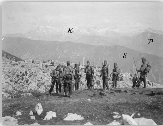
Pripadniki 27. domobranskega pehotnega polka med planinskim pohodom na Matajurju, v letih pred prvo svetovno vojno.

do trdnjave Kluže. Skladno s to nalogo so bile tudi njegove stotnije v poletnih mesecih razporejene na tem območju, saj so pripadniki obeh bataljonov zapustili svoje mestne kasarne ter se namestili v manjših kasarnah po vaseh ob meji z Italijo. Posamezne stotnije prvega bataljona so bile razporejene: prva v Bovcu (Kluže), druga v Breginju, tretja v Logjeh, četrta skupaj s strojničnim oddelkom v Kobaridu in peta na Livku. Poveljstvo drugega bataljona je bilo poleti nameščeno v Tolminu, kjer se je nahajal tudi strojnični oddelek ter šesta stotnija, sedma je bila v Srednjem pri Kambreškem, osma v Kanalu, deveta pa v Kojskem. Iz teh vasi so hodili na pohode v