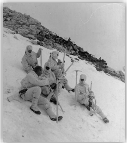
Patrulja visokogorske stotnije HGK13/LIR27, leta 1916 v krnskem pogorju. Oblečeni so v bele maskirne kombinezone, z belimi trakovi imajo ovite tudi puške, cepine pa imajo prebarvane z belo barvo.

Visokogorska stotnija št. 59, je pripadala 59. gorski brigadi in so jo sestavljali skrbno izbrani in gora vajeni pripadniki te brigade. Svoj bazni tabor je imela v taboru »Bartolo lager« pri Žabnicah. V neposredni bližini tabora je Julius Kugy, takrat v službi kot alpinistični referent v 59. gorski brigadi in odličen poznavalec Julijskih Alp, v Trnovem logu (Bartolo graben) ustanovil plezalno šolo s