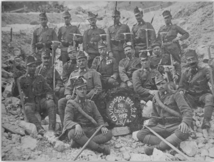
Pripadniki 7. Visokogorske stotnije, med katerimi je tudi nekaj domačinov iz Posočja.

V osnovi je vsaka visokogorska stotnija štela okoli 200 mož. Razdeljeni so bili v tri pehotne vode, en vod lahkih strojnic, tehnični oddelek in dve patrulji telefonistov. Poleg ostale zimske in visokogorske opreme je imel vsak vod še 20 parov smuči in številna bela maskirna ogrinjala.