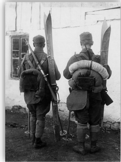
Pripadnika smučarskega oddelka visokogorske stotnije. Na hrbtu nosita le spodnji, manjši del telečnjaka, namenjen nošenju streliva, na katerem imata pritrjeno odejo, desni vojaka pa še plezalno vrv. Oba imata čez ramo obešene smuči, ki so opremljene z vezmi vrste Bilgeri.