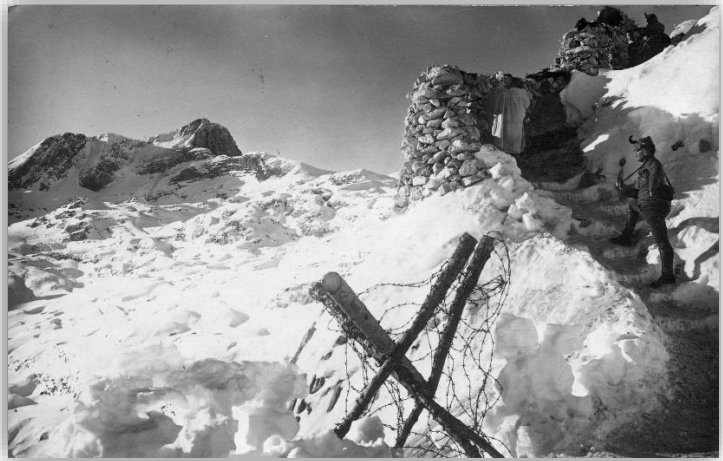
Bojni položaji 3. Bataljona LIR27 na Velikem Lemežu v krnskem pogorju.

30. avgusta se je bataljon odpeljal na Koroško bojišče, v Rabelj in se tam združil s polkom, ki se je vrnil iz ruskega bojišča. Prvi bataljon je bil že 27. avgusta premeščen na območje Rombona, medtem ko sta ostala dva bataljona, združena s pripadniki 9. pohodnega bataljona za dva tedna zasedla položaje v gorah nad Rabljem. V drugi polovici septembra 1915 pa sta bila tudi ta dva bataljona premeščena na bovško bojišče, kjer sta zasedla položaje med Velikim Lemežem in Šmohorjem, poveljstvo polka pa je bilo na planini Duplje pri Krnskih jezerih. Posamezne stotnije so bile nameščene tudi na Planini Golobar, Javorščku in na bojnih položajih na Bovškem polju. Na teh položajih je polk ostal devet mesecev, do pomladi 1916. Posebno hudih bojev na tem področju ni bilo, vendar je polk kljub temu utrpel izgube, nekaj tudi