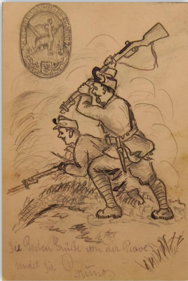
Dopisnica z ročno narisanim motivom dveh gorskih strelcev, ter polkovne značke 2. Gorskega strelskega polka.

Tako so predvidevali priročniki za bojevanje v gorah. V praksi pa je bila med vojno opremljenost vojakov velikokrat odvisna od razpoložljivih zalog opreme na posameznem delu bojišča in od iznajdljivosti posameznikov.