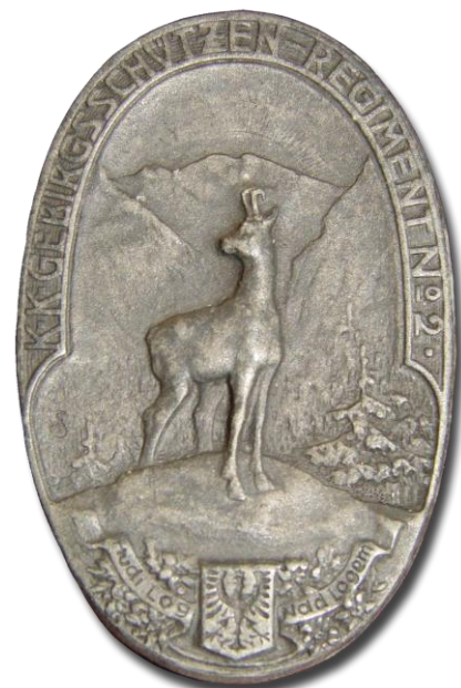
Polkovna značka 2. gorskega strelskega polka izdelana v spomin na hude boje na kraški planoti jeseni 1916, na kar spominjata imeni dveh bojišč: Hudi Log - Nad Logem, na spodnjem delu značke. (zbirka avtorja)

ponovno premeščen na počitek v zaledje kraškega bojišča, prvi in drugi bataljon v Koprivo, tretji pa v Hrušico. 19. marca 1917 se je polk preimenoval v Gorski strelski polk št. 2 ( K.k. Gebirgs Schützen Regiment N.2, GSR2 ). Proti koncu aprila so v Koprivi priredili veselico v korist vdovam in sirotam padlih vojakov, ki je trajala cel teden. V začetku maja je zasedel bojne položaje pri Špacapanih, 23. maja pa je bil polk ponovno premeščen v zaledje, kjer je prebil 10. soško ofenzivo. 8. junija je bil za nekaj dni nameščen v vasicah Tabor in Brdo pri Dornbergu, a že čez tri dni premeščen v strelske jarke pri Špacapanih. Tako je deloma v strelskih jarkih pri Špacapanih, deloma na počitku v Taboru in Brdu prebil poletne mesece. V 11. soški bitki je bil najprej pri Špacapanih, od 4. do 11. septembra 1917 pa je skupaj z nekaterimi drugimi enotami branil hrib Škabrijel. V hudih bojih je utrpel velike izgube, izgubil je 30 častnikov ter 1173 mož. Za obrambo hriba je bil polk posebej pohvaljen, častniki in vojaki pa so si prislužili 1432