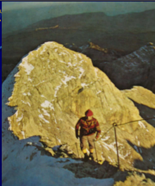
Vir: Triglav gora naših gora, 1980 (Več avtorjev). Na grebenu Triglava. Foto: Maks Škerl.