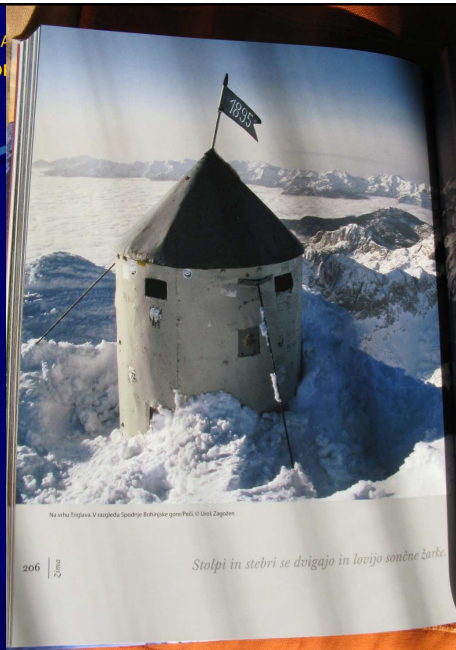
Aljažev stolp.