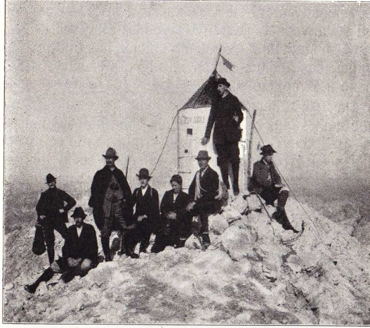
R. Badiura: Aljažev stolp na vrhu Triglava.

Velikim Triglavom, konačno grebenom 1 Velikoga Triglava do Aljaževoga stupa 2 na vrhu. Tomu putu