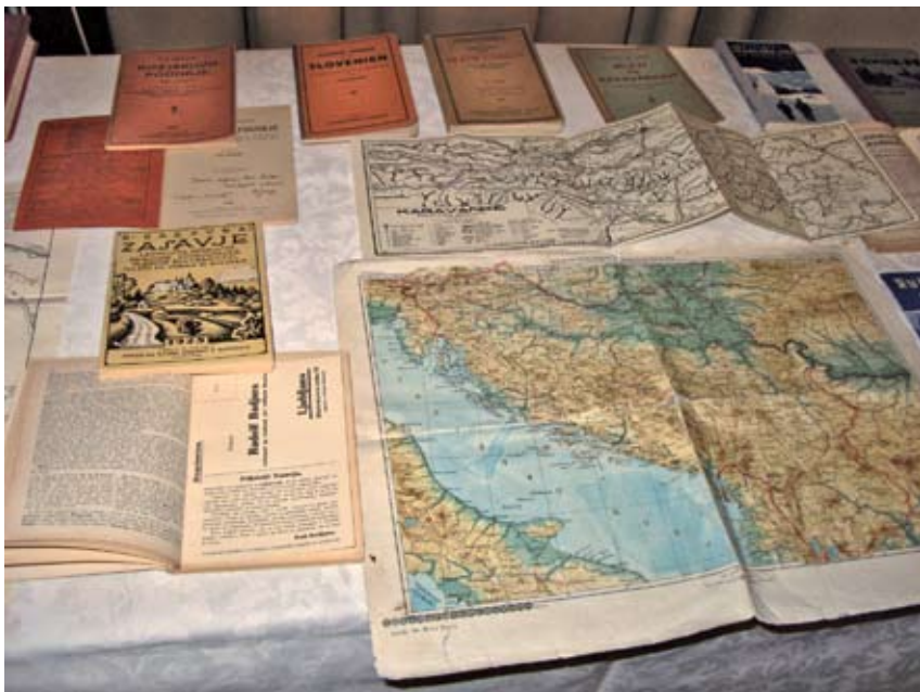
Del Badjurovega publicističnega opusa, foto: Herman Berčič

Badjura se je navduševal bolj nad nordijsko-alpsko tehniko, s katero se je seznanil na vojaških smučarskih tečajih pred prvo svetovno vojno. Kot navaja avtor, je vsa svoja takratna znanja, spoznanja in izkušnje s smučarskih terenov strnil v knjigo oz. smučarski priručnik Smučar . Bil je prvi, ki je na slovenskem govornem področju pripravil izčrpen smučarski vodnik, v katerem je sis-