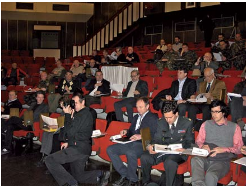
Avditorij v Poljčah z referenti